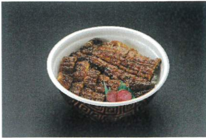
※薬味付、出汁はついてません 上ひつまぶし井 3,780円(税込4,082円)