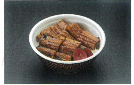
うな特井 3,180円(税込3,434円)