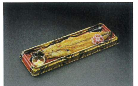
白焼(单品) 2,960円(税込3,197円)