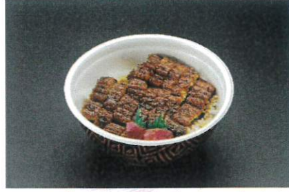
※薬味付、出汁はついてません ひつまぶし井 2,880円(税込3,110円)