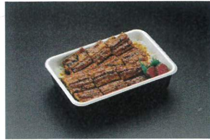
上うな重 3,680円(税込3,974円)