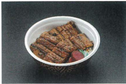
うな上井 2,780円(税込3,002円)