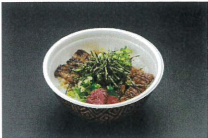
上まぶし井 2,180円(税込2,354円)